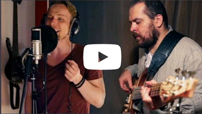
„Breathing Under Water“ ansehen