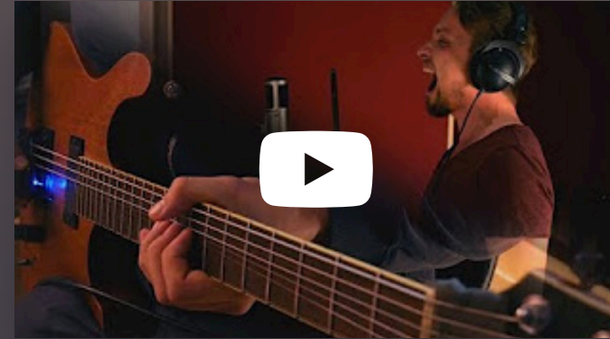
„Let Go“ ansehen