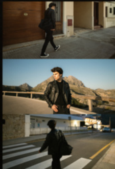
Too late to come back home