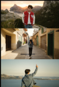
Right Person Wrong Time