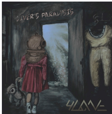
(EP 2015 4LANE - Diver's Paralysis)