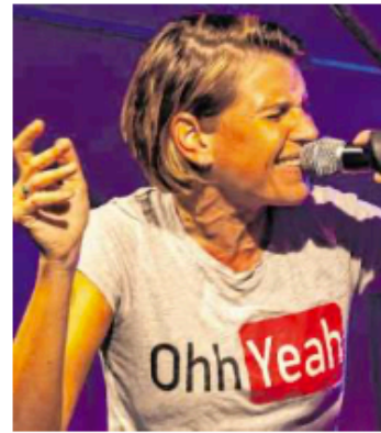
Sängerin Ly Energy.