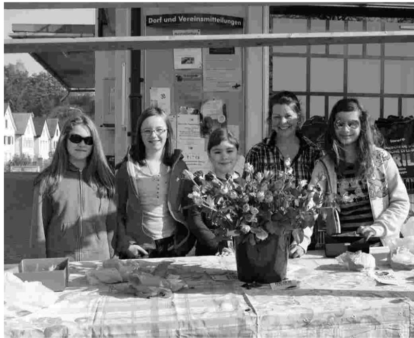
Aus Solidarität mit dem Süden: Die Wartauer Schülerinnen warten auf Rosenkäuferinnen und -käufer.