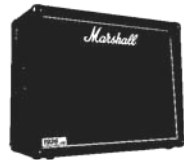
2 x Strom