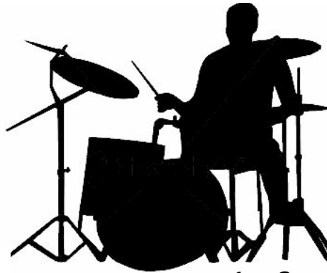
1 x Strom