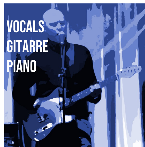
VOCALS GITARRE PIANO