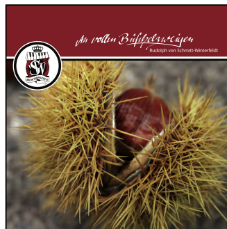
An vollen Büschelzweigen 2016 (Vinyl)