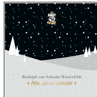
Alle Jahre wieder 2011 (CD)