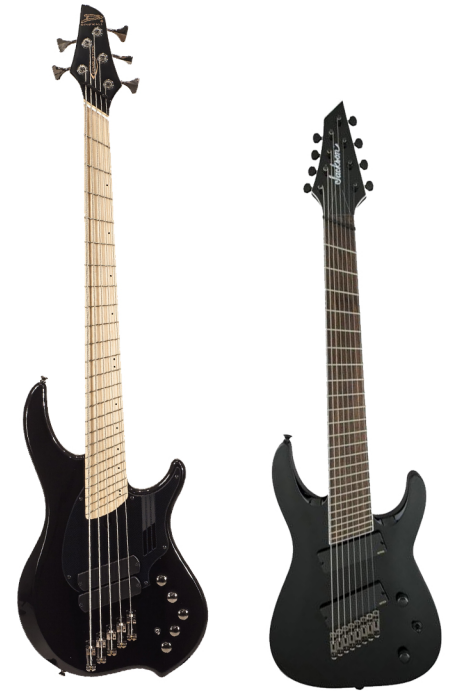
Dingwall NG-2 Combustion 5 BK Jackson Soloist X Arch Top SLAT8 MS