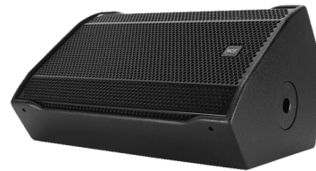
min. 2x Stage-Monitor Center (Rest der Band hat InEar)

FOH / PA Wenn möglich: X32 Pult inkl. Stagebox min. 2 Sub's 2 Top's 4 Monitore 1 4x12er Gitarrenbox (Fill) 4-8x 10er Bass Box (Fill)