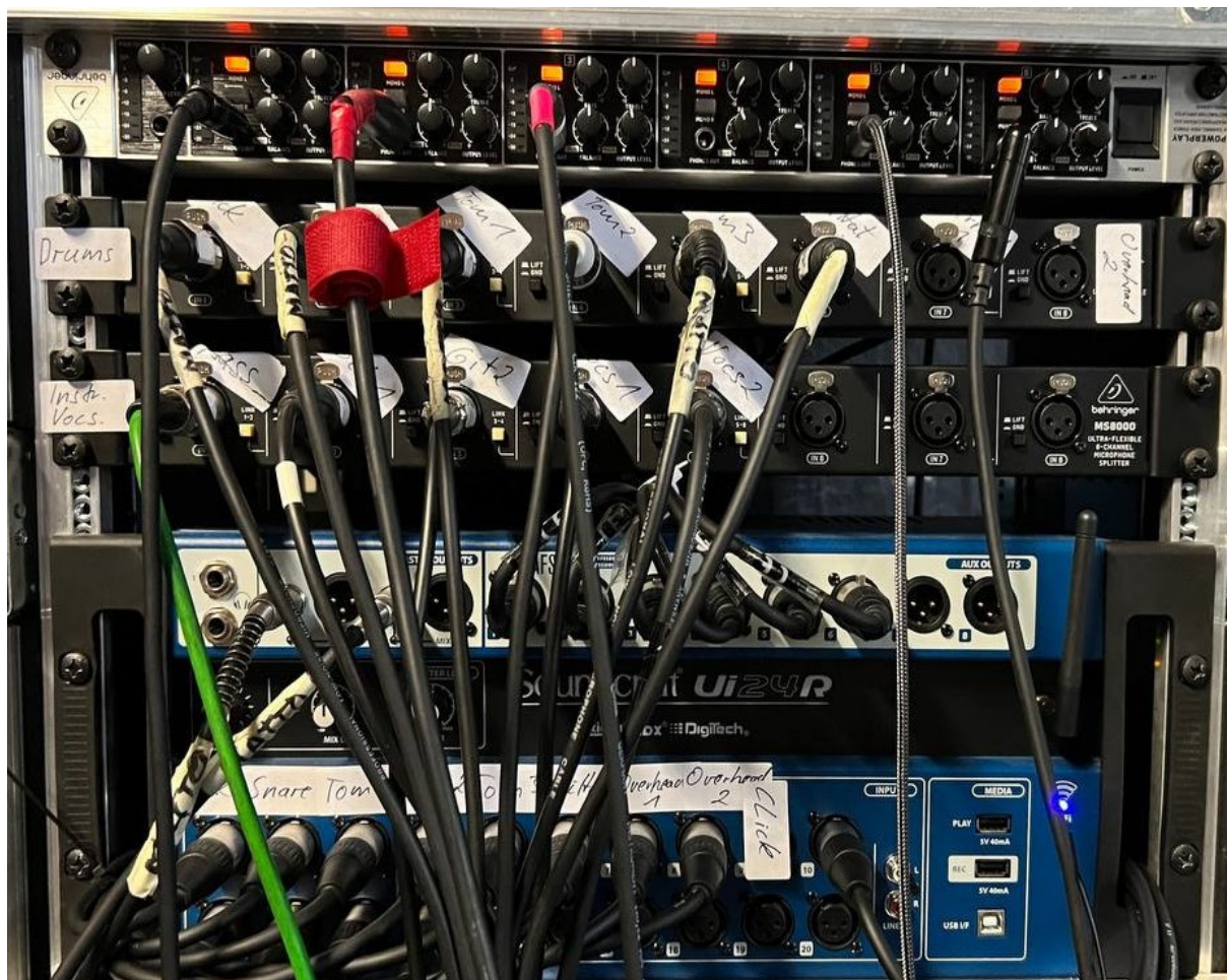
Schaubild 1: Rack mit Kopfhörerverstärker (oben), Splitbox 1 für Drum-Mikrofonierung (darunter), Splitbox 2 für Instrumenten- und Vocal-Mikrofonierung (Mitte) und Soundcraft UI24R (ganz unten, blau).

Die Eingänge der Splitboxen als auch die Multicore-Stecker sind eindeutig beschriftet!