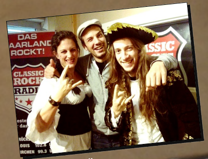
Classic Rock Radio

Mit Bands wie bspw. D'artagnan bespielen die SaarRocker bereits Bühnen wie die auf Deutschlands größtem Fantasie und Rollenspielkonvent.