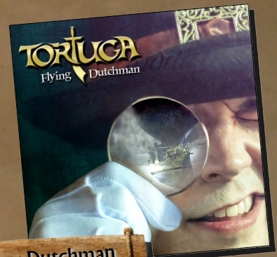
Flying Dutchman 2021