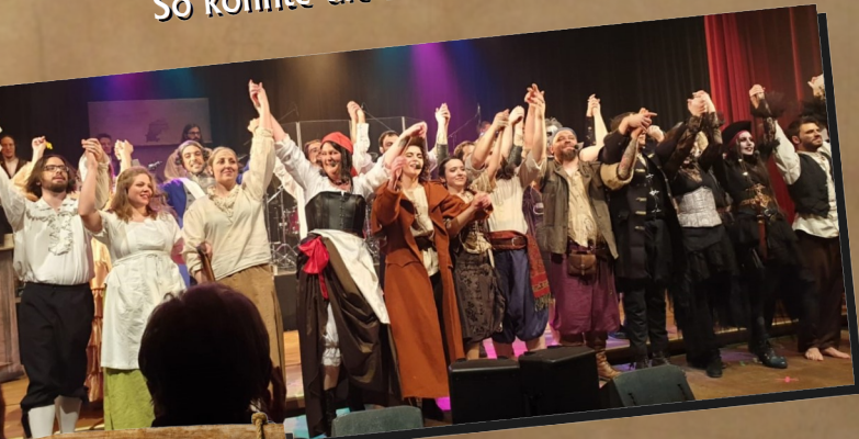
Metal Oper 2019

Das Fünfergespann stammt aus der Saaribik (Saarland). Was 2015 einst im Duett als Studioprojekt begann ist 2019 zu einer charismatischen Band zusammengewachsen, die durch ihre Beständigkeit und ihr Engagement bereits fünf Alben auf den Weg brachte. Die Kraft schöpfen TORTUGA aus ihrem Tun, dem Miteinander und der Hingabe zur Musik. So konnte die Band auch problemlos die Zeit von Pest und Cholera überstehen.