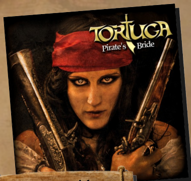
Pirates Bride 2015

Nach ihrem ersten Album "PIRATE'S BRIDE" (2015) erscheint die Flagge Tortugas zum ersten Mal am Horizont und lässt auf den Bühnen das Piratenleben aufblühen indem sie mit ihren Texten dem Gedanke an Freiheit und Abenteuer frönen.