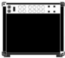
Guitar (1x Strom, 1x Mic)