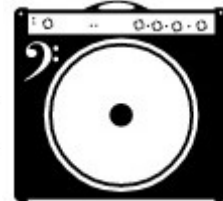
Bass (1x Strom)