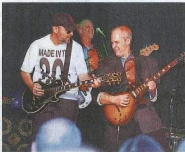
„The 80s Band“ schlägt im Groß-Gerauer Kulturcafé nostalgische Töne an.

Am Samstagabend spielt „The 80s Band“ zur Zeitreise auf und hat alles im Repertoire, was sie und ihn in den