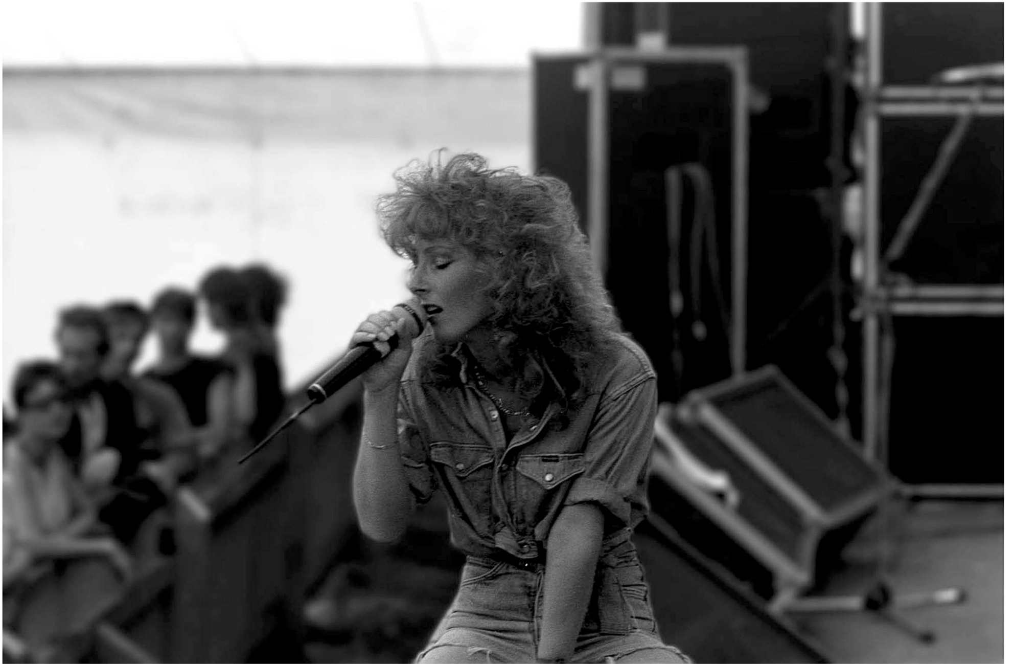
Live, Jübek 1989