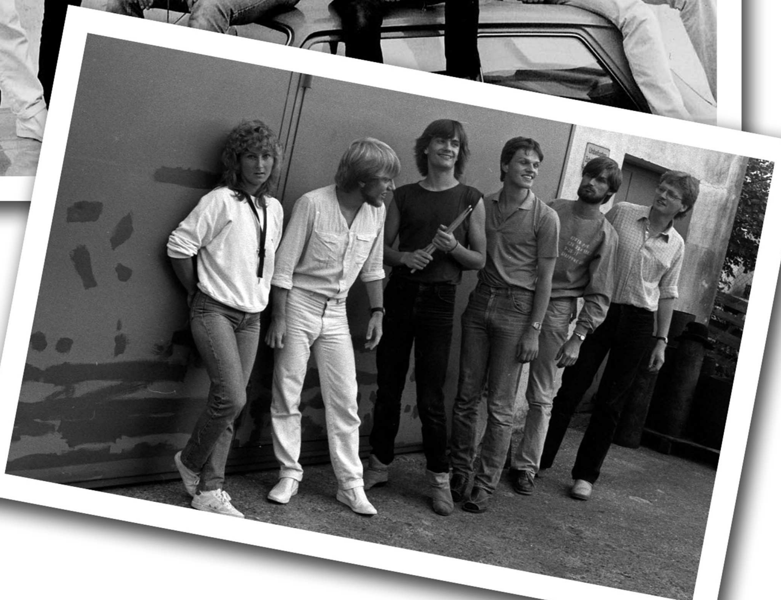
Photo sessions 1984