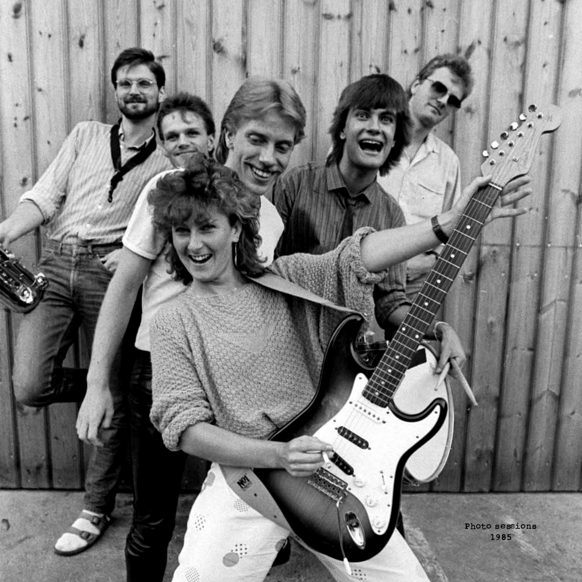
Photo sessions 1985