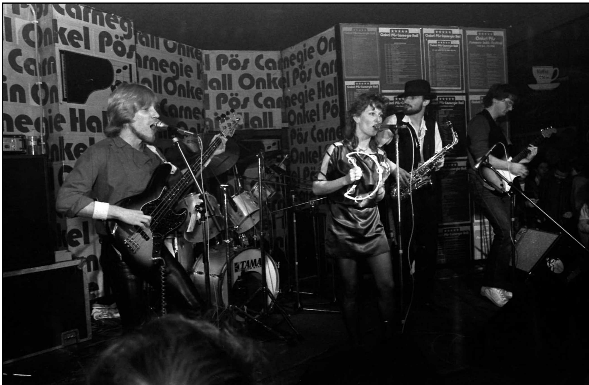
Onkel Pö, Hamburg 1984