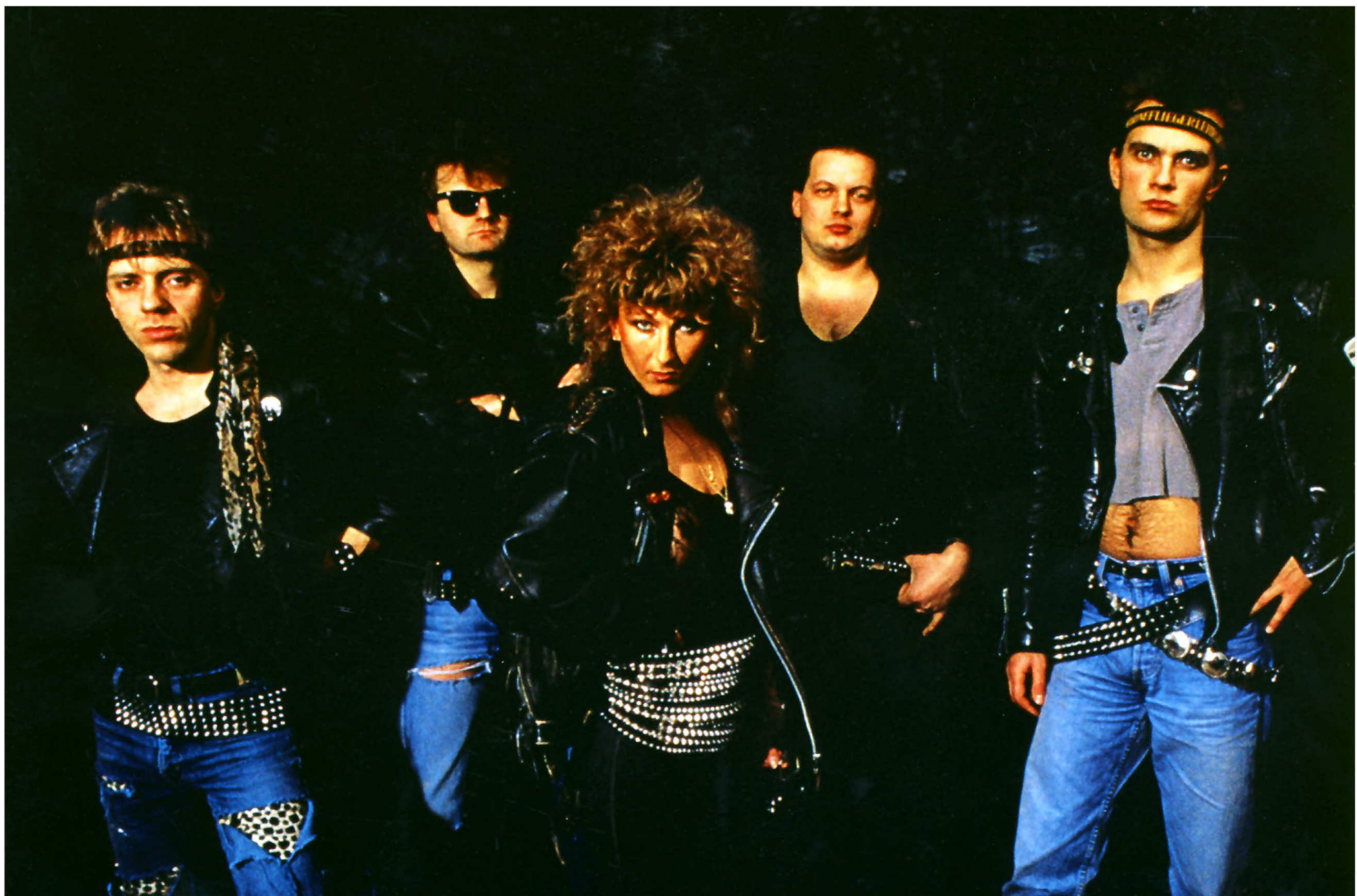
Photo session 1989