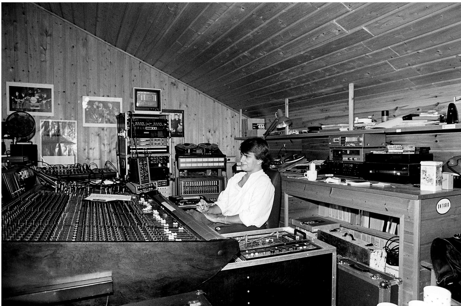
Studio Recording, Lüneburg 1990