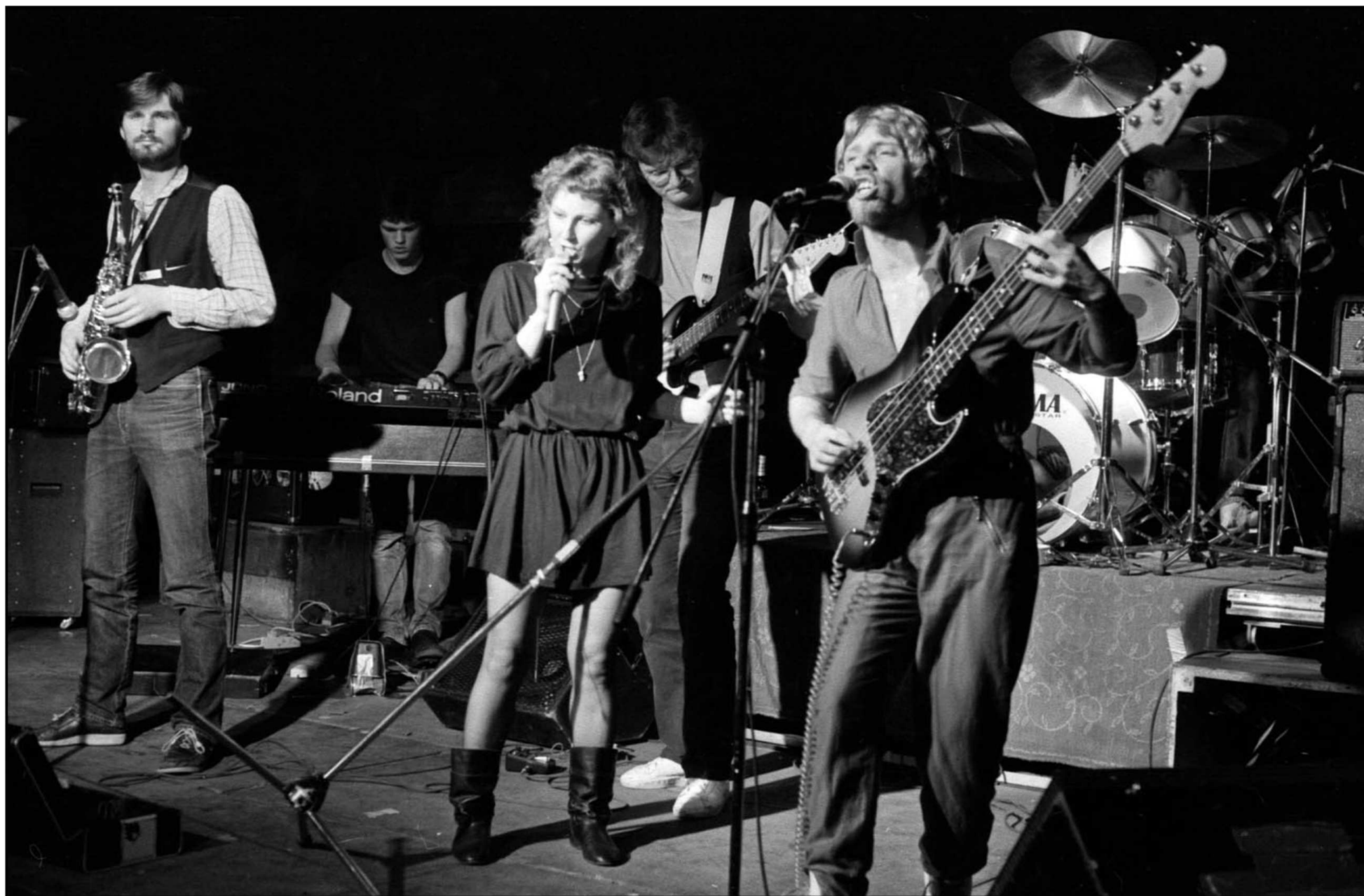
Fabrik, Hamburg 1984