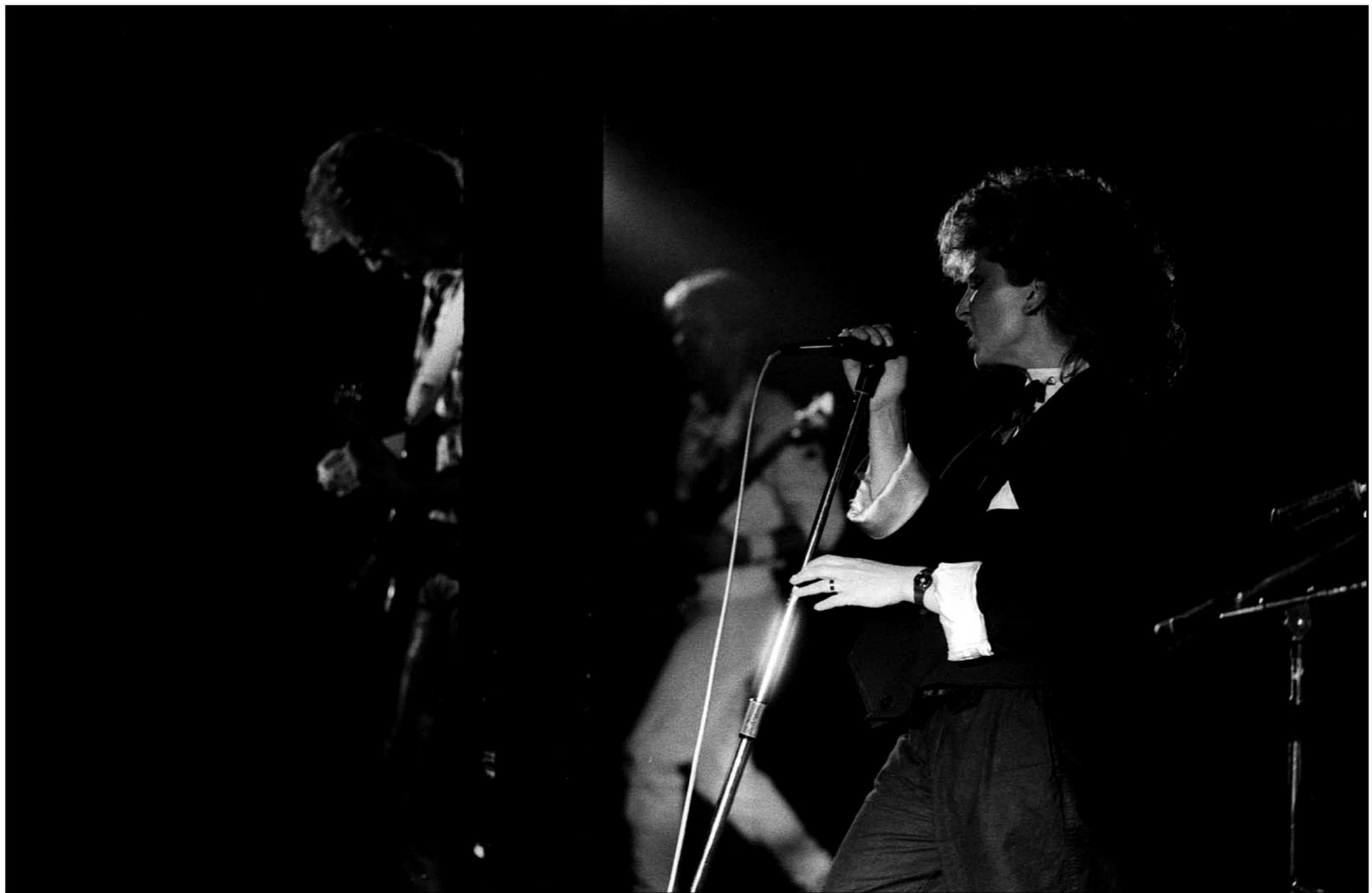
Logo, Hamburg 1985