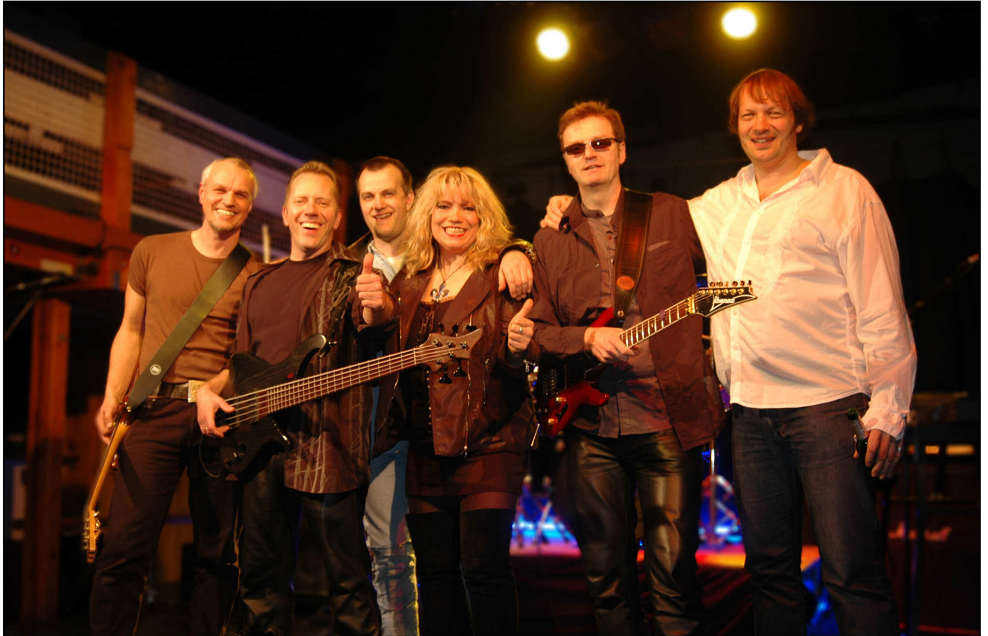
Räucherei, Kiel 2009