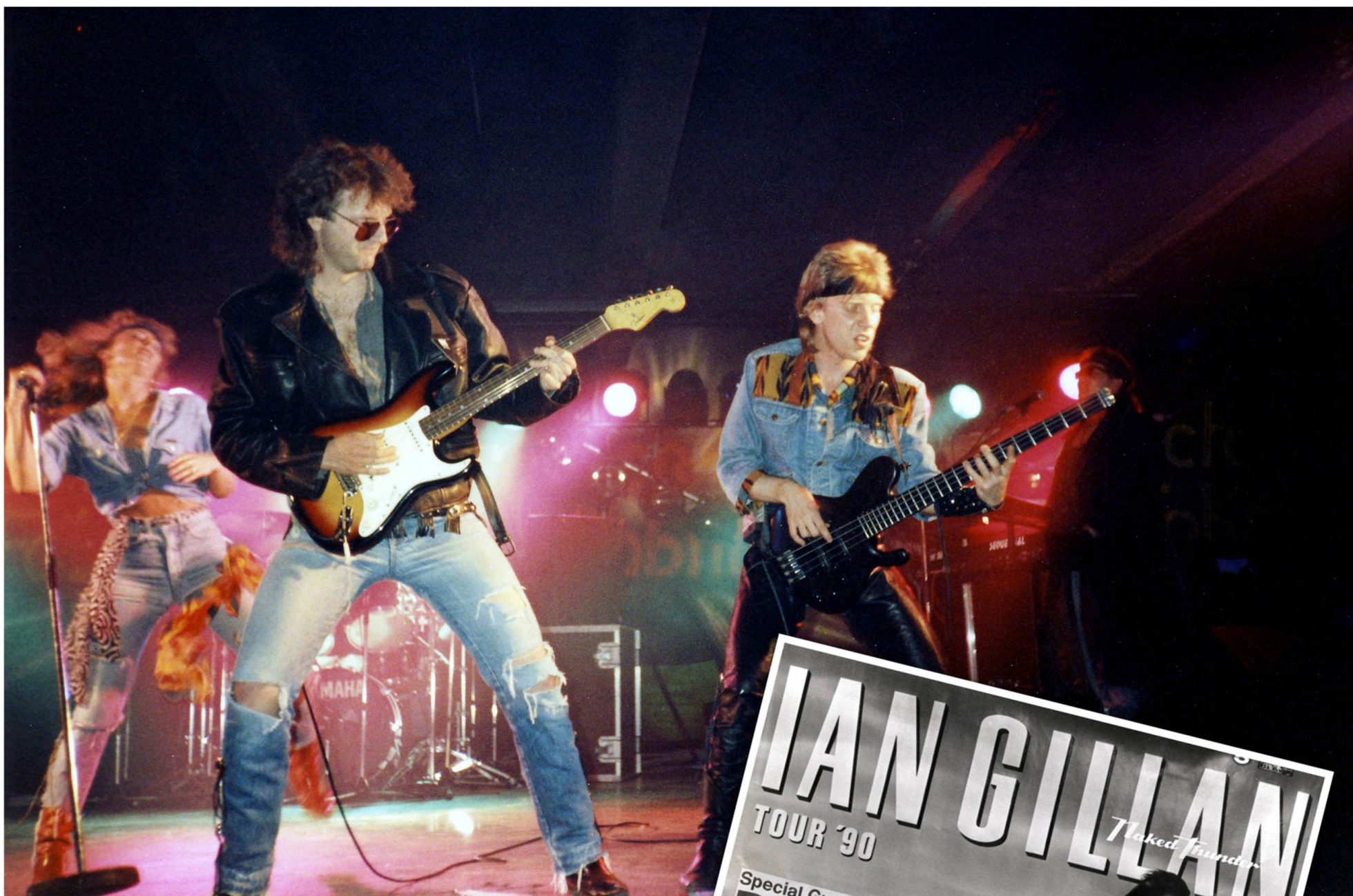
Live on stage 1990