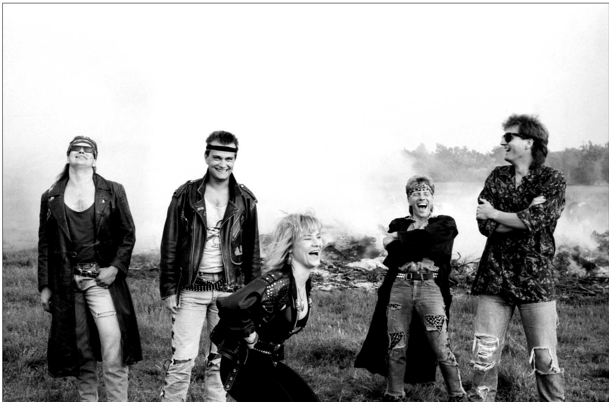
Photo session 1993