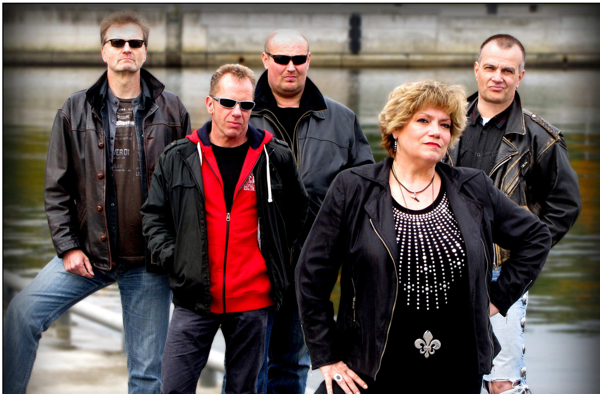
Photo session, Kiel 2013