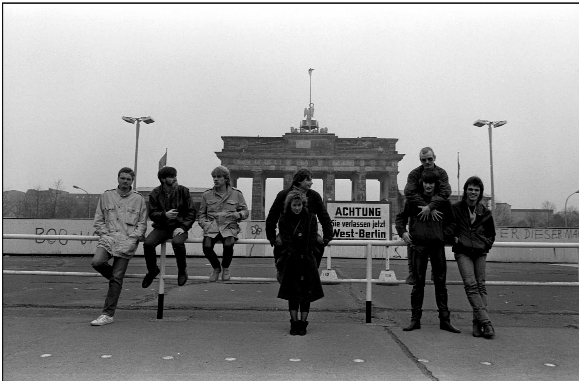
The Wall, Berlin 1984