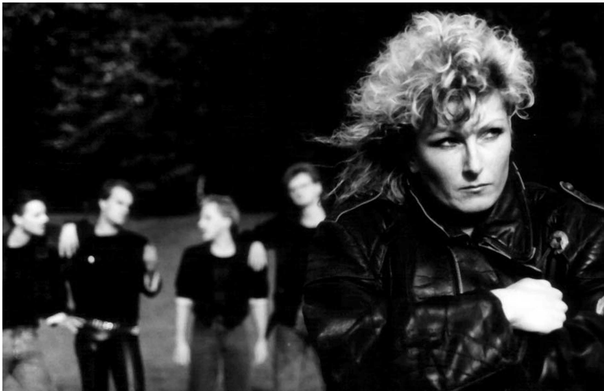
Photo session, Hamburg 1988