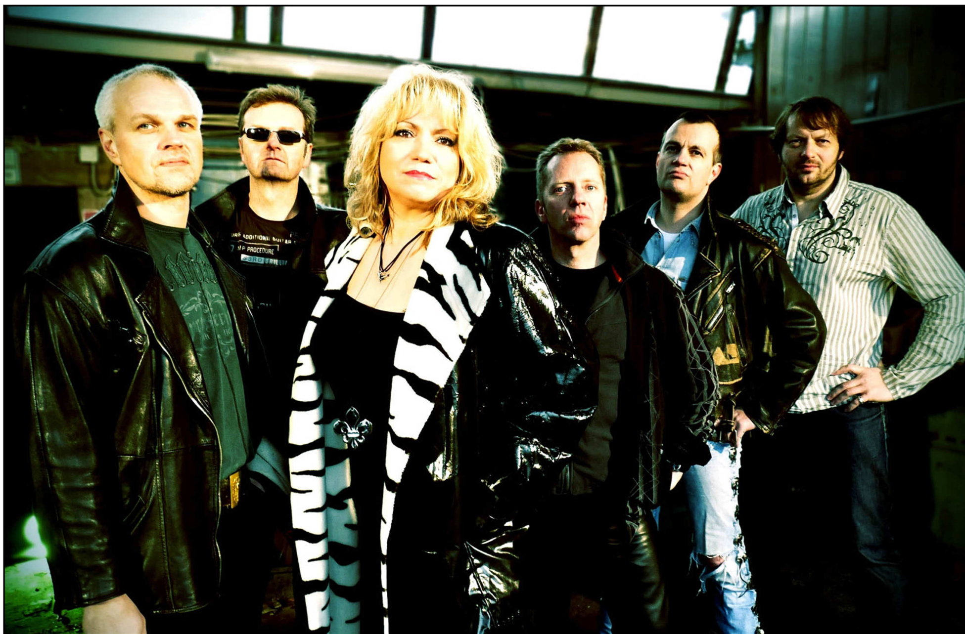
Photo session 2008