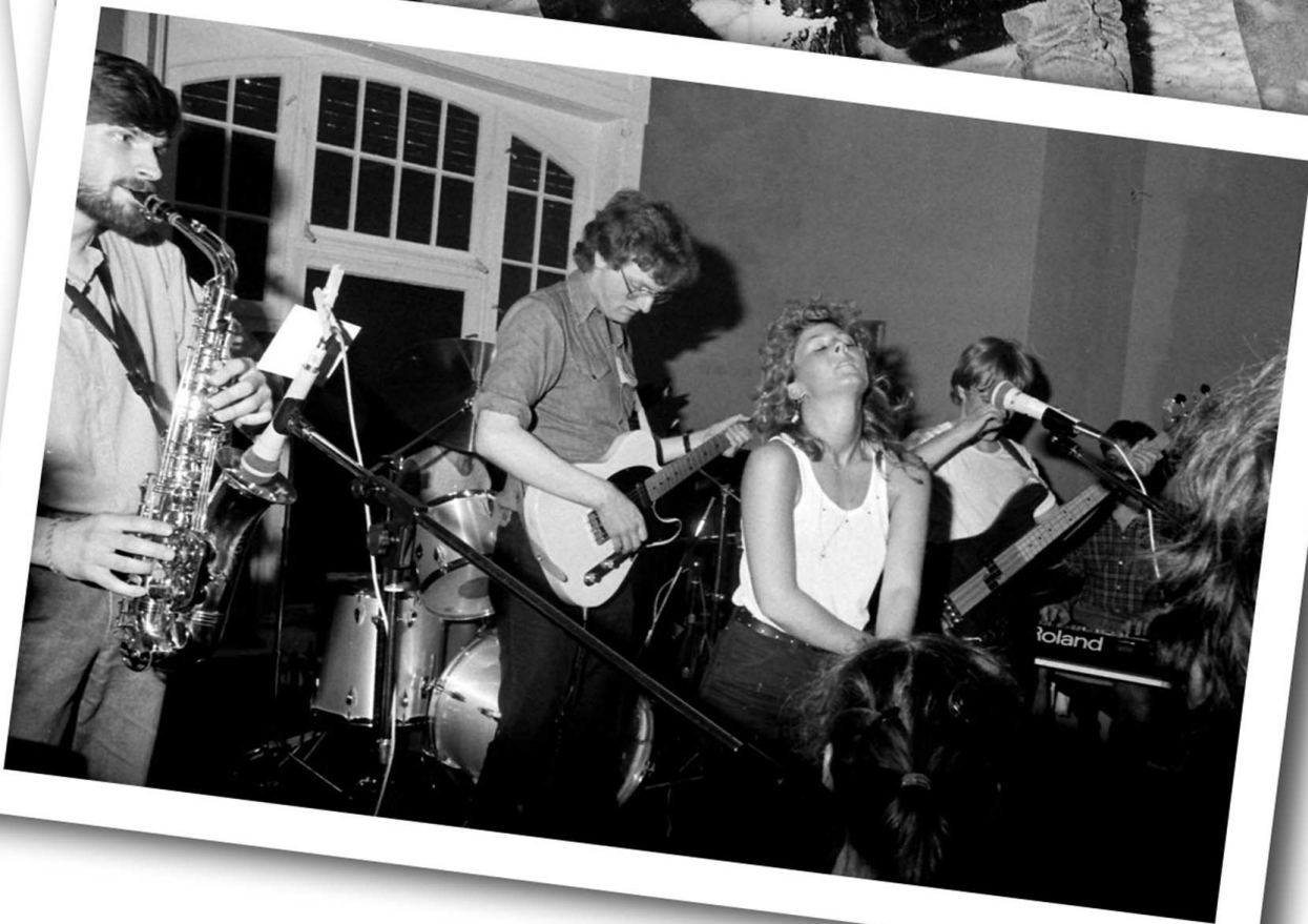
First band photo Winter 1983/84