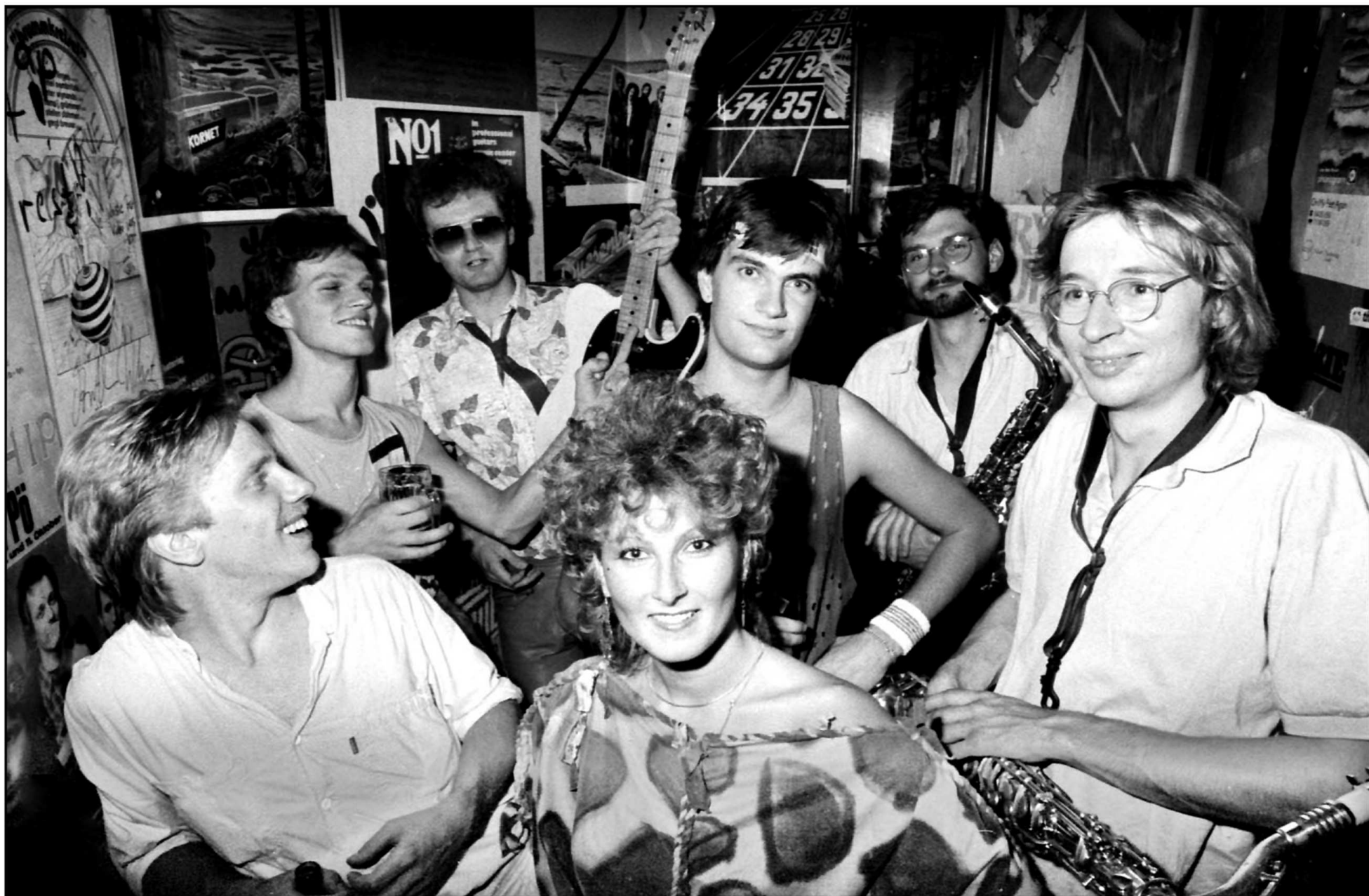
Onkel Pö, Hamburg 1985