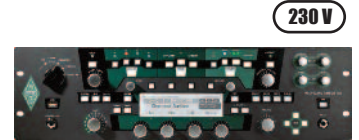
Stephan / Git