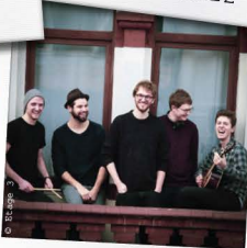
ETAGE 3 21.07.2022