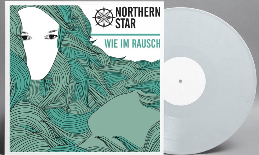
WIE IM RAUSCH (SINGLE) // 2012