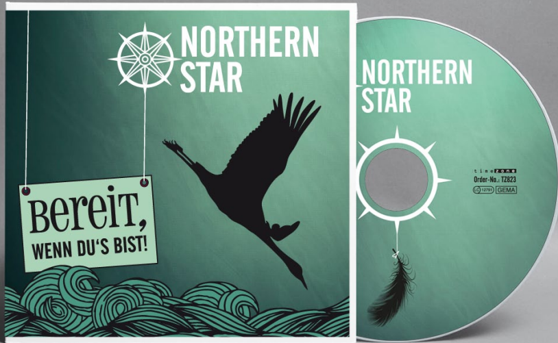
BEREIT, WENN DU'S BIST! (ALBUM) // 2012