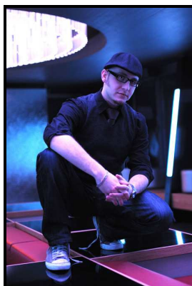
Achim Guitars, Vocals