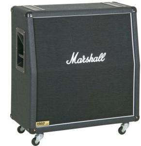
Gitarre 1 - Marshall 4x12er + Topteil