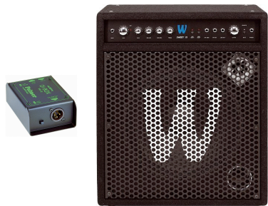
Bass - Warwick Sweet 15