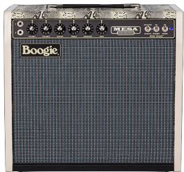
Gitarre 2 - Mesa Combo

So schaut unsere Bühnenanordnung aus, dieser Fall wäre mit der minimalen Anzahl von Monitoren, wenn wirklich sieben da sind, schau wir, wo wir sie unter kriegen...!