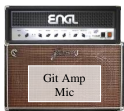
Git Amp Mic