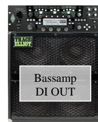
Bassamp DI OUT