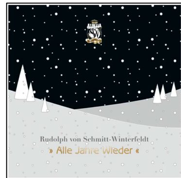
Alle Jahre wieder 2011 (CD)