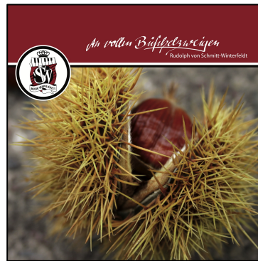
An vollen Büschelzweigen 2016 (Vinyl)