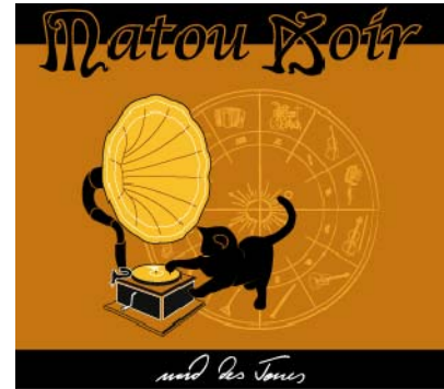
und des Tones. pro ton music 2012