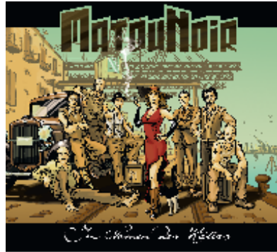
Im Namen des Katers. pro ton music 2010