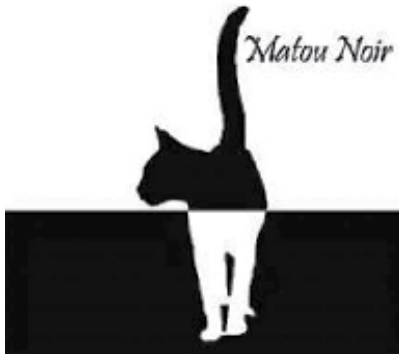
Matou Noir. 2008